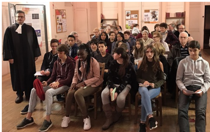
Culte du 12 novembre avec les catéchumènes

Votre trésorière, comme l'ensemble du Conseil, invitent chacun à porter ce sujet dans la prière afin que tous puissent intervenir selon leurs moyens. « Que chacun donne comme il l'a décidé, non pas à regret ou par obligation : car Dieu aime celui qui donne avec joie » (2 Cor 9,7)